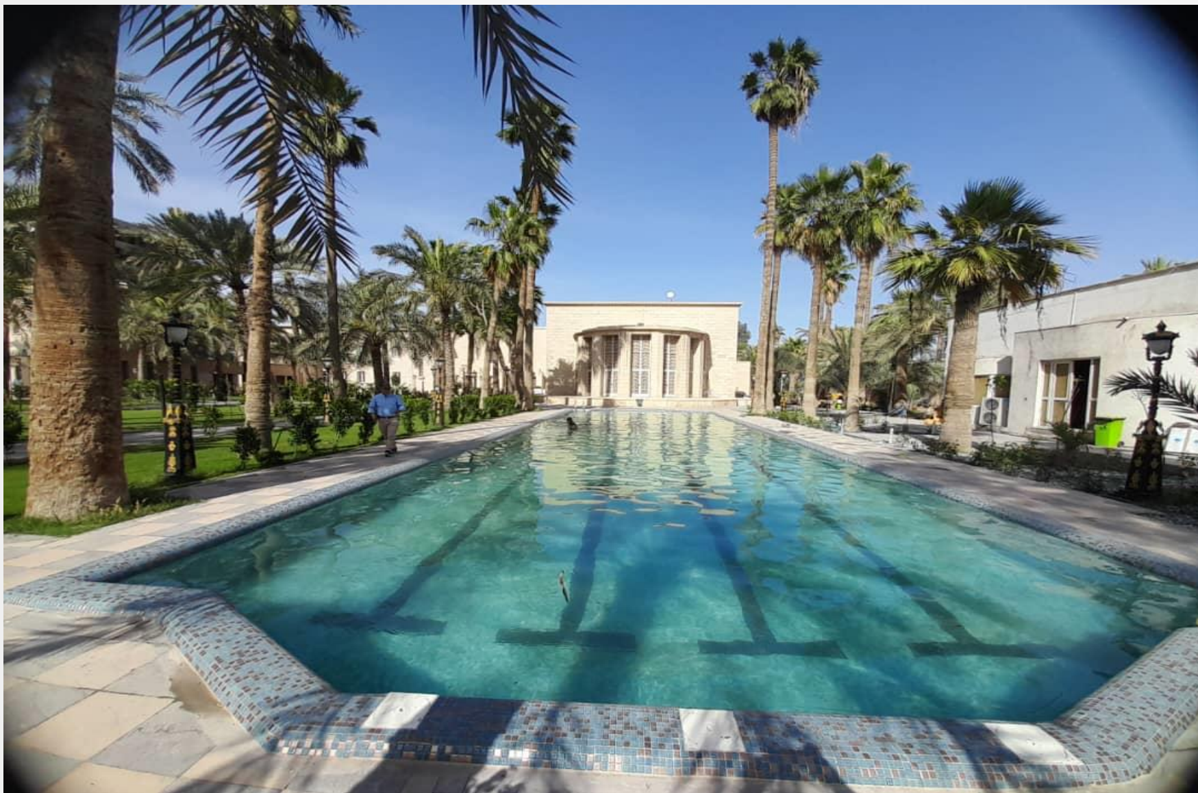
پروژه طرح مرمت و ساماندهی سفارت جمهوری اسلامی ایران در بغداد