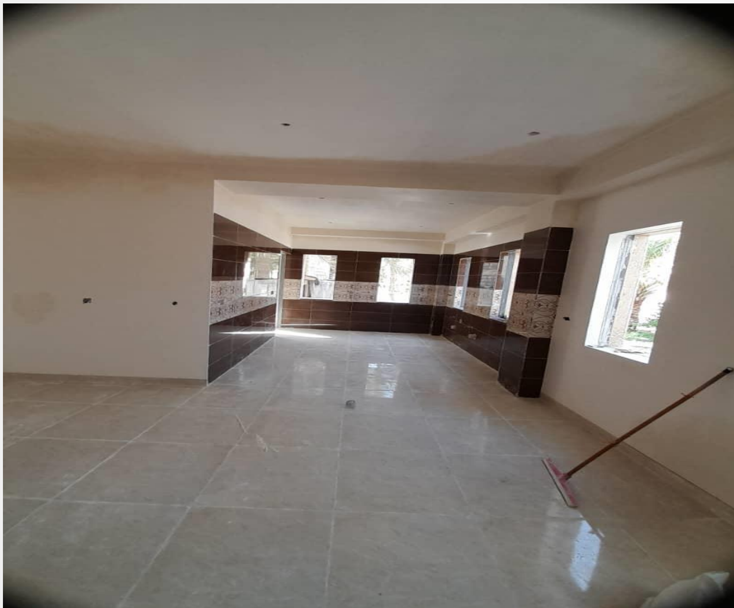
پروژه طرح مرمت و ساماندهی سفارت جمهوری اسلامی ایران در بغداد