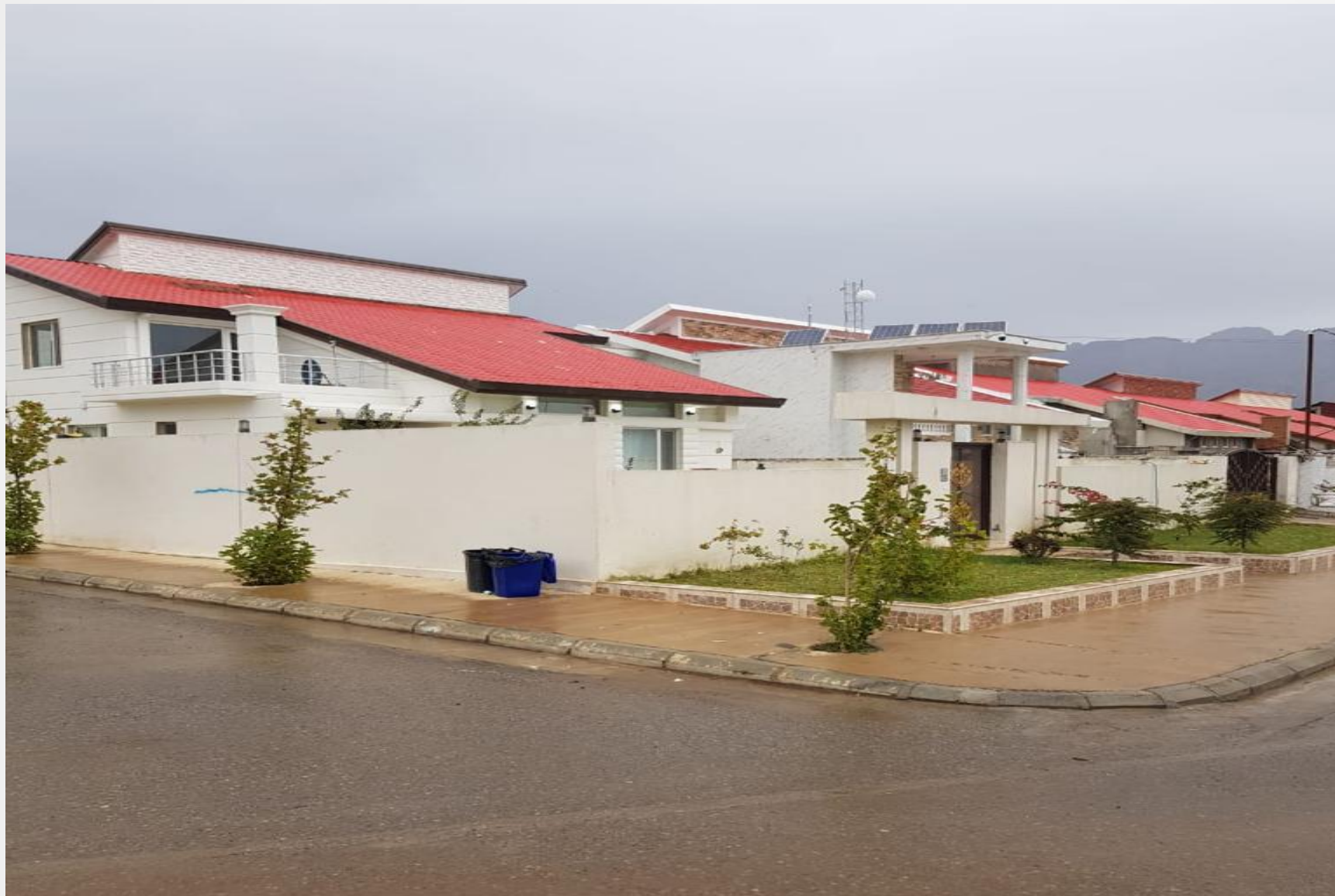
همکاری با شرکت ساختمانی لوتکه پروژه شهرک ۲۲۰۰ واحدی زیتون