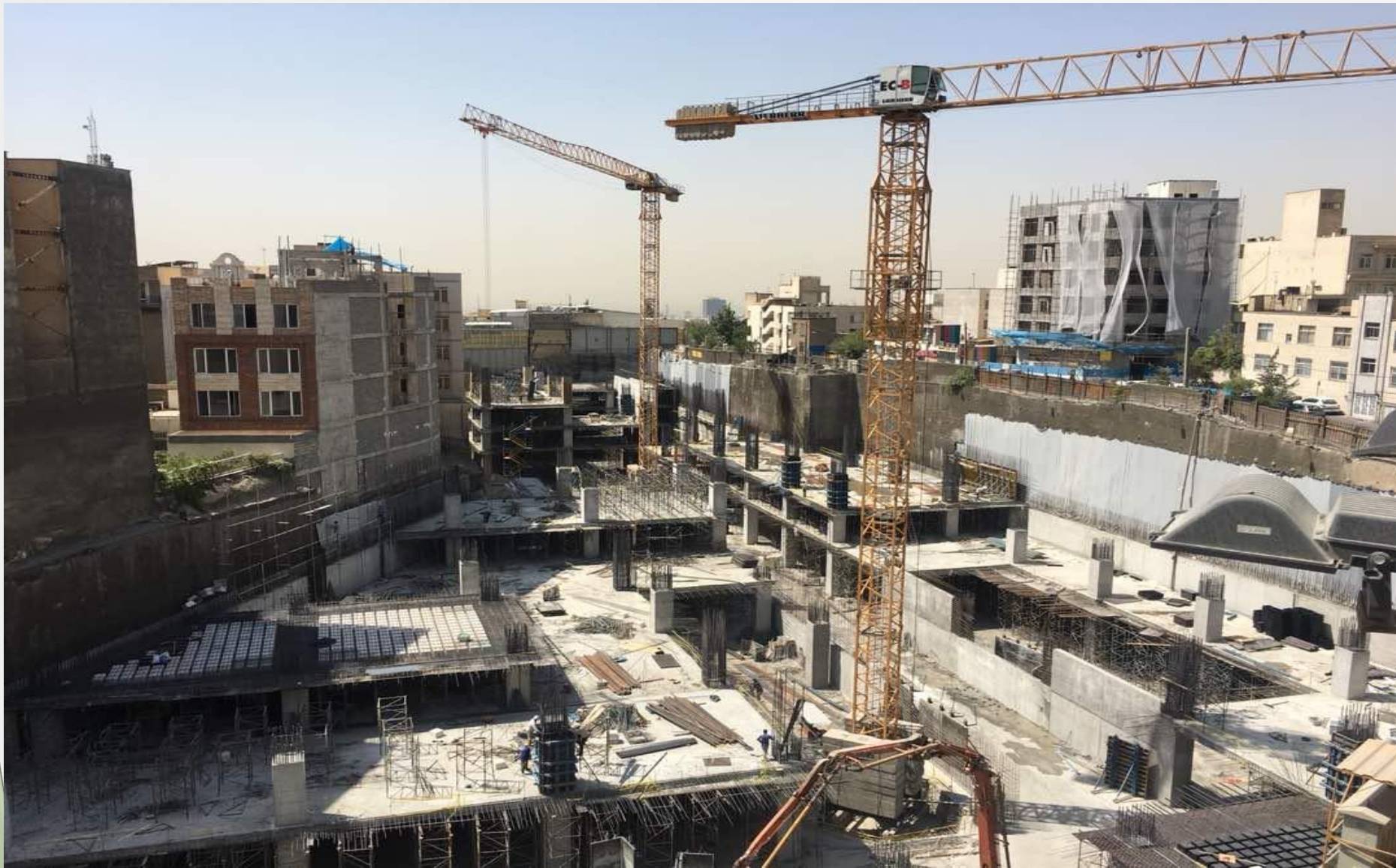
همکاری با شرکت پیمانکاری استراتوس پروژه ساختمانی سهیل - تهران