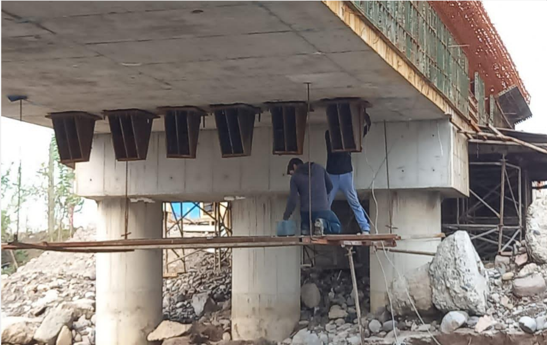
همکاری با شرکت پیمانکاری استراتوس پروژه راه آهن رشت - کاسپین