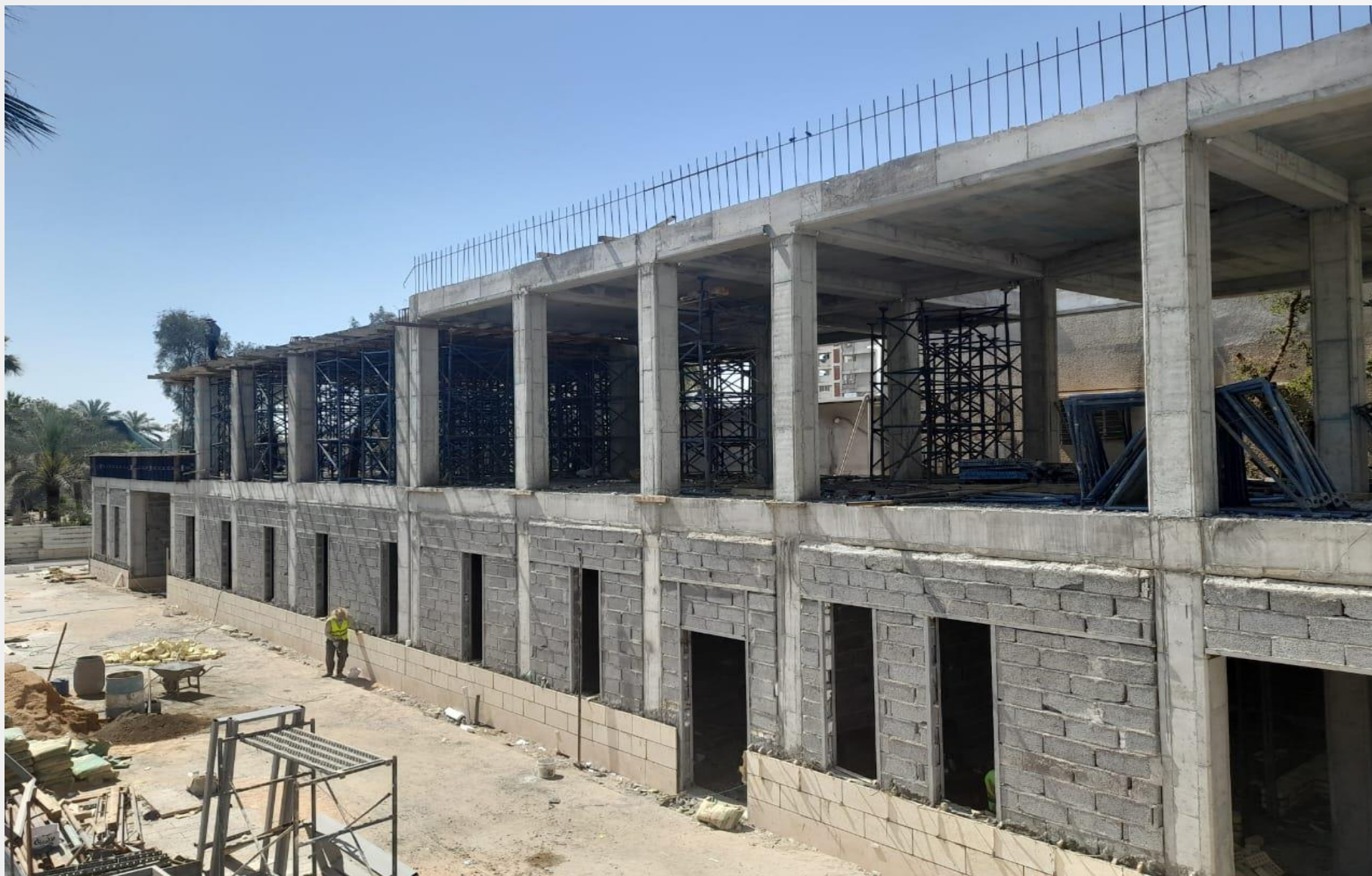
پروژه طرح مرمت و ساماندهی سفارت جمهوری اسلامی ایران در بغداد