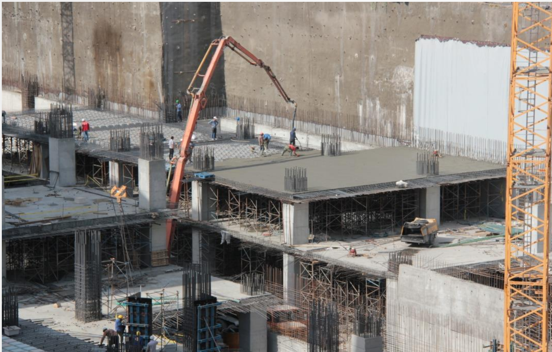
همکاری با شرکت پیمانکاری استراتوس پروژه ساختمانی سهیل - تهران