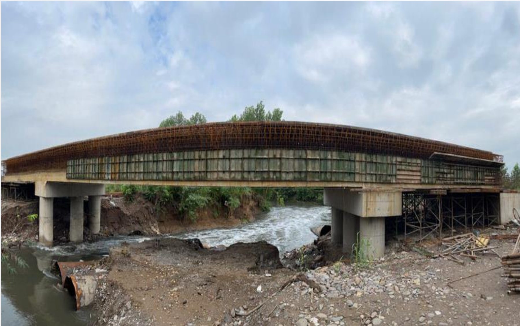
همکاری با شرکت پیمانکاری استراتوس پروژه راه آهن رشت - کاسپین