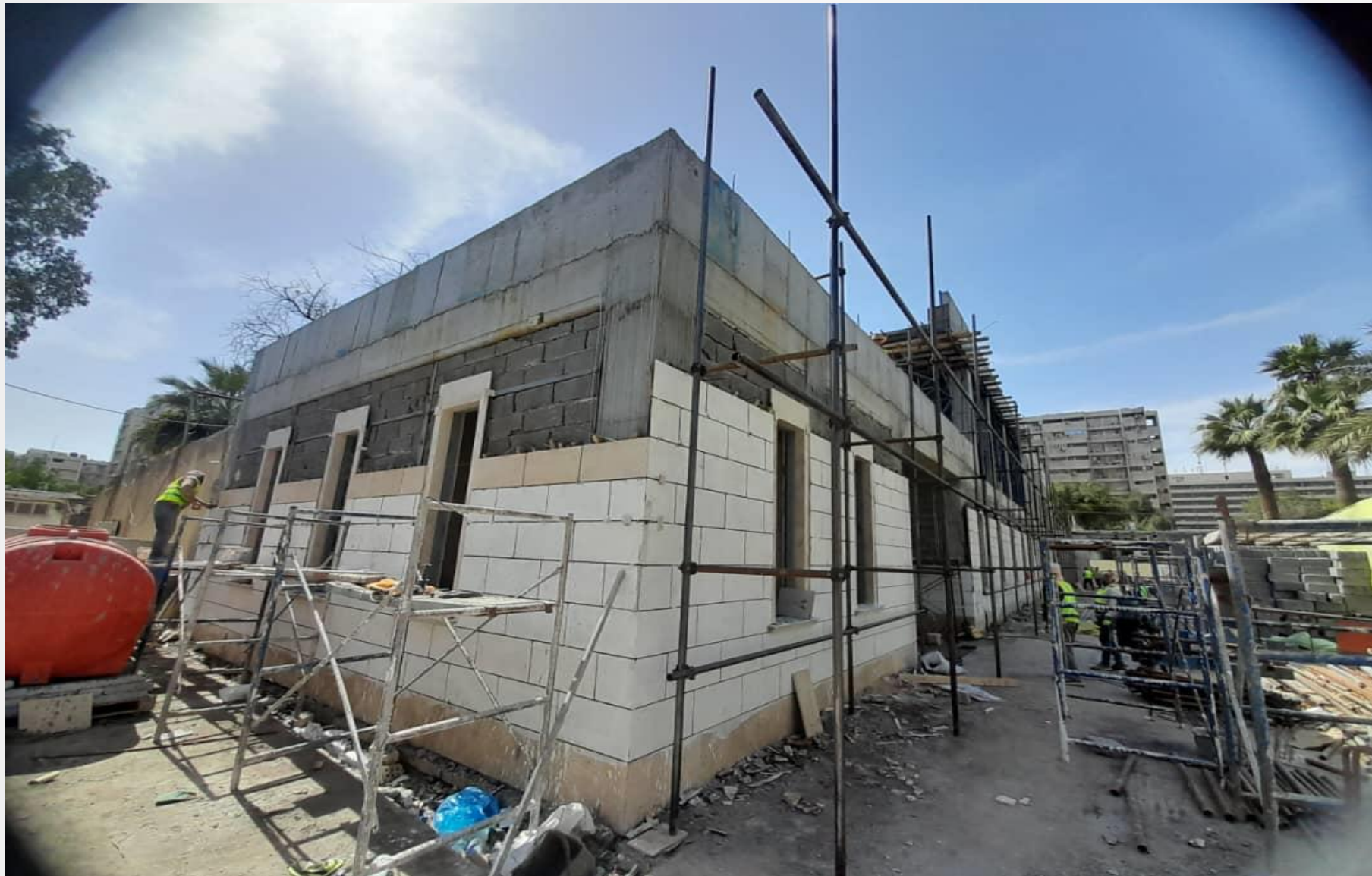
پروژه طرح مرمت و ساماندهی سفارت جمهوری اسلامی ایران در بغداد