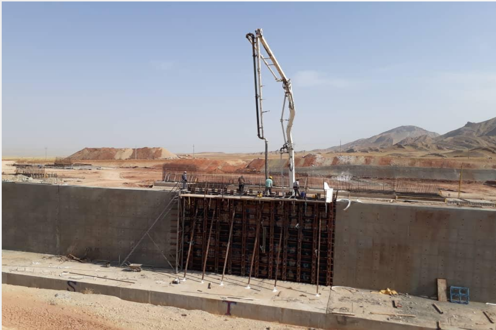
همکاری با شرکت پیمانکاری استراتوس پروژه گرمسیری - آپخش