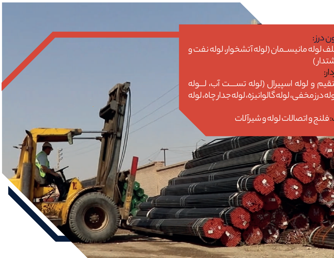
جدول وزن مقطع لوله

انواع لوله بدون درز: رده‌های مختلف لوله مانپس‌مان (لوله آتشخوار، لوله نفت و گاز و لوله گوشتدار) انواع لوله درزدار: لوله درز مستقیم و لوله اسپیرال (لوله تست آب، لوله تست گاز، لوله درز مخفی، لوله گالوانیزه، لوله جدار چاه، لوله داریستی) انواع اتصالات: فلنج و اتصالات لوله و شیرآلات